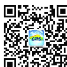
微信定位公众账号 999GPS