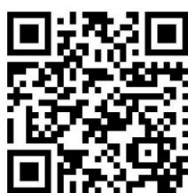
Android 安卓 App 下载安装