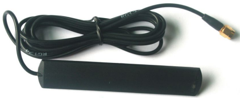
拧到主机上指示GSM的插座上