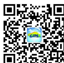
微信定位公众账号 999GPS