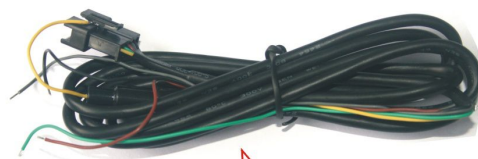
5P线： 红或棕色：9-40V电源 黑色：车体或接地线 黄色：断油断电输出 灰色：外接SOS按键 绿色：ON线(可不接)